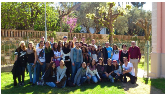
Estudiants del Centre d'Estudis Roca

14.04.2015 i 12.05.2015. Visites del Centre d'Estudis Roca. Estudiants de segon curs del grau superior d'integració social.